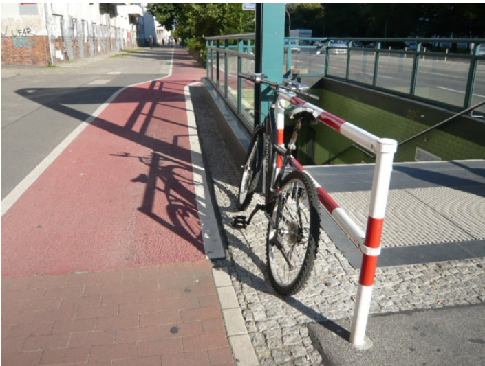
Foto 2: nordwestlicher Ausgang Magdalenenstraße – am Geländer angeschlossenes Fahrrad = Gefährdungspotenzial