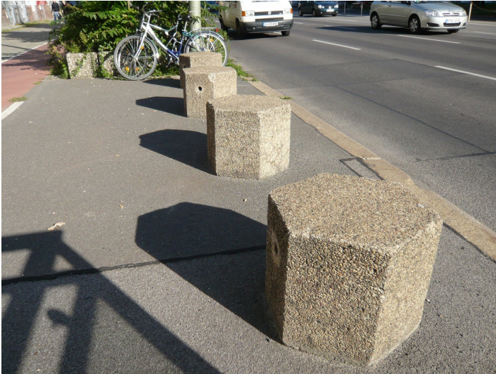
Foto 1: nordwestlicher Ausgang U-Bahnhof Magdalenenstraße – freie Fläche, wenn man die Poller entfernt