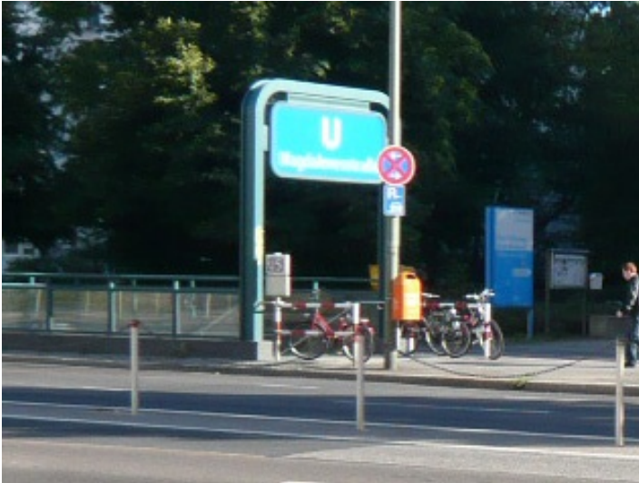
Foto 3: südwestlicher Ausgang Magdalenenstraße - am Geländer angeschlossene Fahrräder = Gefährdungspotenzial